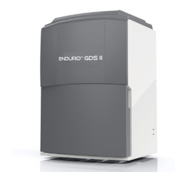
Enduro GDS II